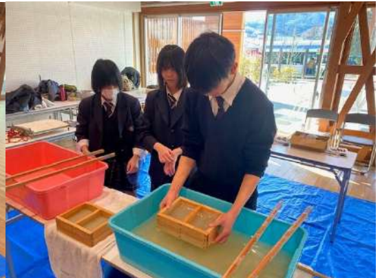
戸倉コウゾの和紙作り体験