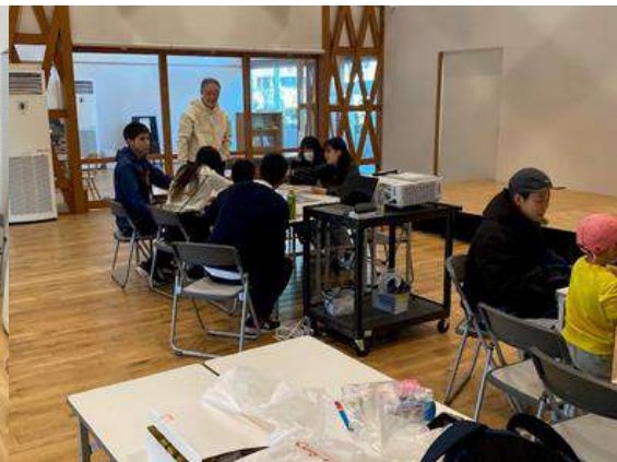
ゲームで学ぼうお金のこと